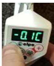
Zmniejszanie temperatury wyświetlanej

Analogicznie gdy chcemy podnieść temperaturę wyświetlaną. Wyświetlacz wskazuje np. 20^{\circ}\text{C} , a rzeczywista temperatura wynosi 22^{\circ}\text{C} , wtedy przyciskiem „plus” ustawiamy temperaturę „2.0C” i koniecznie akceptujemy naciskając jednokrotnie przycisk WEEK/TURBO/OK. Jeśli wszystko wykonamy prawidłowo to po około 15min. nastąpi wyrównanie wskazań.