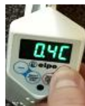
Zwiększanie temperatury wyświetlanej