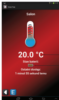
Reprezentacja czujnika RCT-01 w aplikacji mobilnej

RCT-01 to uniwersalny bezprzewodowy czujnik temperatury zasilany bateryjnie. Protokół komunikacyjny jest zgodny z systemem exta free. Czujnik dedykowany jest wyłącznie do współpracy z kontrolerami systemu (EFC-01 lub EFC-02). W przypadku współpracy z EFC-02 możliwa jest tylko wizualizacja wartości temperatury w urządzeniu mobilnym. Przy współpracy z EFC-01 zmierzona wartość temperatury można dodatkowo wykorzystać w procesie sterowania na przykład układem ogrzewania, klimatyzacji. Czujnik charakteryzuje się małymi wymiarami i dostosowany jest do montażu w puszkach instalacyjnych. Można go także montować natynkowo (przyklejenie na taśmie dwustronnej lub klejach montażowych)