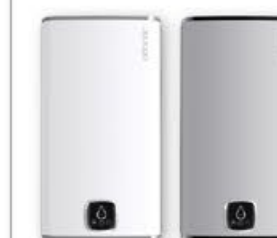
Biały (RAL 9016)